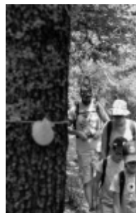
Itinerari de Sant Jaume de Calaons - Escola de Catllar

Les mestres de l'escola Jean Clerc de Prada ens varen demanar realitzar una sortida amb els més petits (curs preparatori - 1r de primària) a Sant Miquel de Cuixà per tal d'iniciar-los en la descoberta d'aquest monestir de tanta importància històrica per a la zona. La sortida